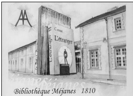
Bibliothèque Méjanès 1810