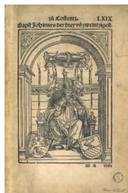
1 re page de l'armorial avec le portrait en pied de l'antipape Jean XXIII (P. 1902)

Il s'agit d'abord d'une histoire du concile de Constance (1414-1418) réuni pour réduire le schisme d'Occident. La première partie ayant disparu, le livre s'ouvre sur le portrait de Jean XXIII (antipape) qui semble illustrer une page de titre qui n'en est pas une. Elle figure sous forme coloriée, avec titre, signature et réclame, à la page consacrée par Wikipédia à cet antipape.