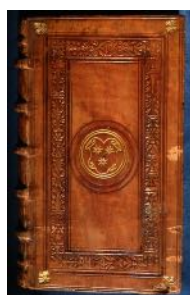
Reliures aux armes de B. Le Court (Rés. D. 457; Rés. D. 487)

Un amateur ultérieur, Gaspard Fieubet de Naulac, les a fait couvrir par les siennes, mais certains éléments restent visibles (Rés. D. 36).