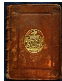
Reliure aux armes de Fieubet de Naulac couvrant celles de B. Le Court (Rés. D. 36)

Un amateur ultérieur, Gaspard Fieubet de Naulac, les a fait couvrir par les siennes, mais certains éléments restent visibles (Rés. D. 36).