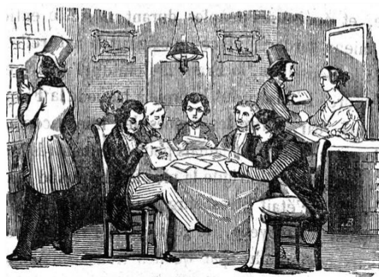
Publicité pour le cabinet de lecture de la librairie Aubin, berceau du Mémorial , Le Mémorial d'Aix , 28 novembre 1844