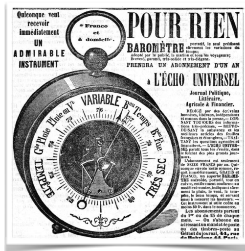
Baromètre offert pour un abonnement à L'Écho universel 8