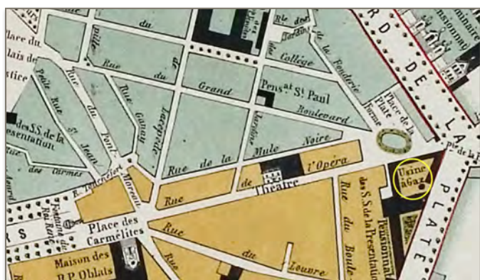
Plan-guide de la ville d'Aix, Makaire, 1869 Quartier est (détail), Musée Arbaud

Cela nécessite aussi une véritable usine de production : deux gazomètres sont installés contre le rempart de la ville, au bord de la place de la Plate-Forme (actuelle place Miollis).