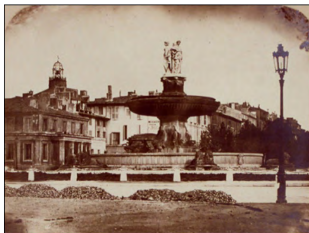
Lanterne à gaz sur la place de la Rotonde Cliché Gondran (vers 1860)

http://bibliotheque-numerique.citedulivre-aix.com http://joelle.jacq.free.fr/SiteAIX/42_Eclairage.html